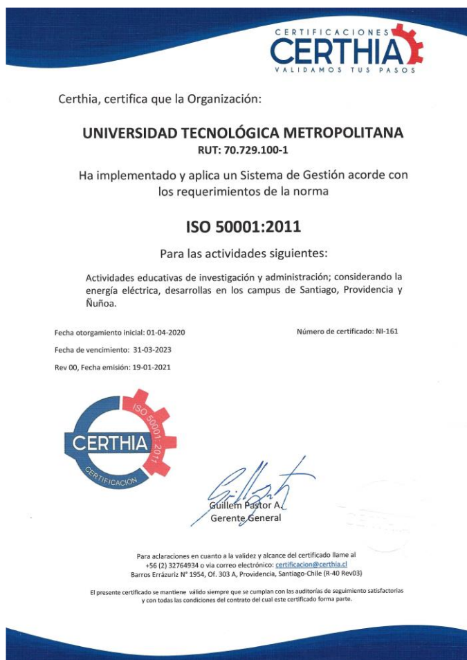
Imagen N°2. Certificado del Sistema de Gestión Energética bajo norma ISO 50001

A inicios del año 2021, el Programa de Sustentabilidad UTEM se presentó a la primera auditoría de seguimiento del Sistema de Gestión de Energía (SGE) UTEM, la cual concluyó de manera exitosa, es decir, en conformidad a los requisitos establecidos por International Organization for Standardization (ISO) 50001:2011.